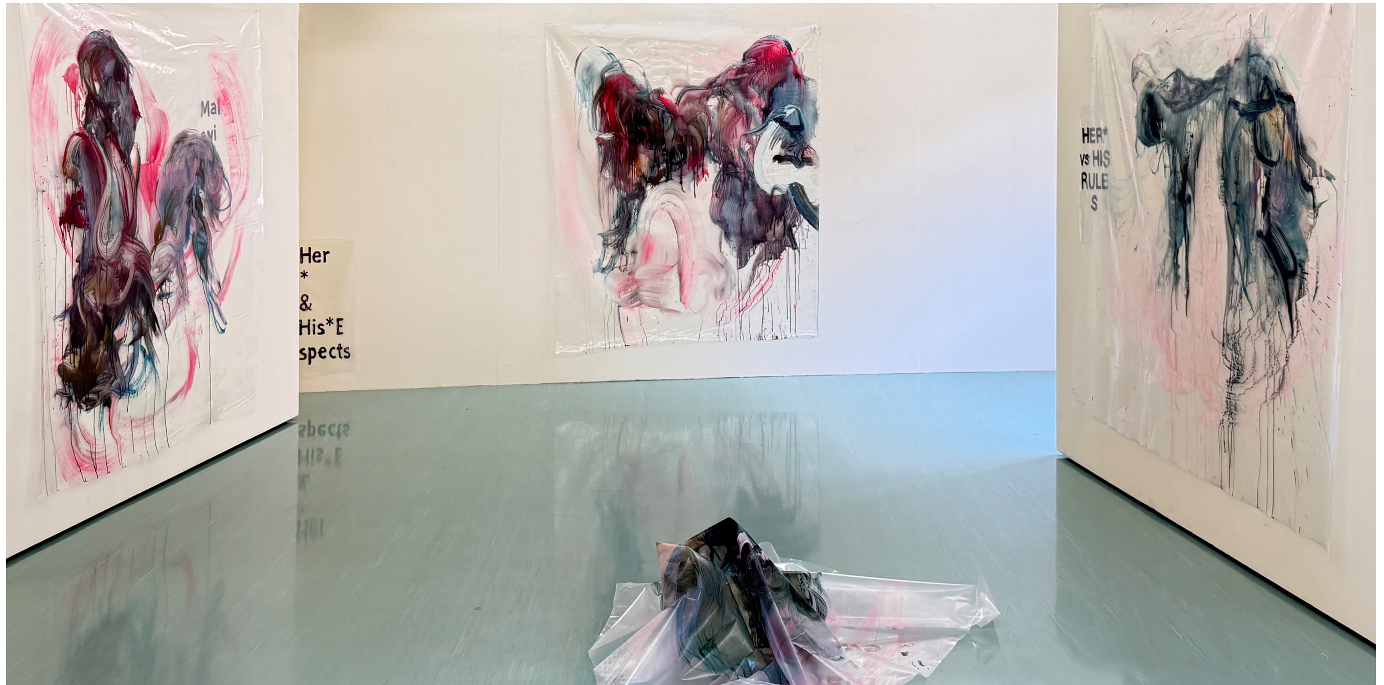
Exhibition view, C.A.P. Confernece of Art and Art projects, Kobe, Japan 2025